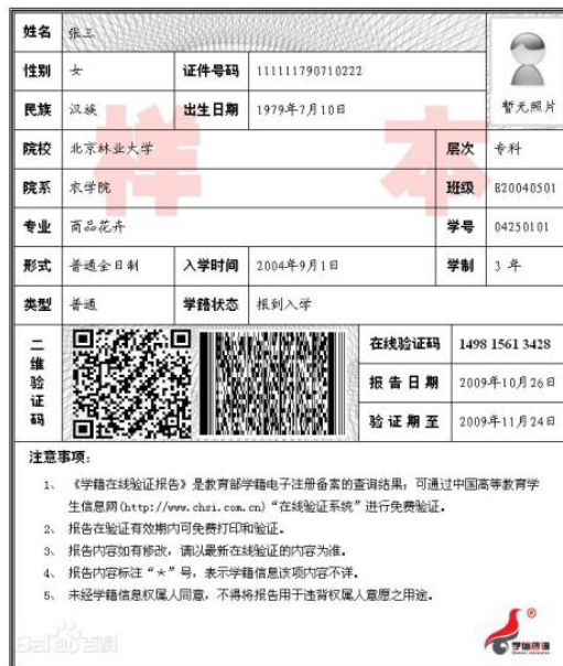
教育部学籍在线验证报告

2. 哈尔滨市户籍的往届毕业生须提供(1)毕业证书照片(毕业证书丢失的提供“中国高等教育学生信息网”的《教育部学历证书电子注册备案表》或《中国高等教育学历认证报告》, 下同); (2)户口簿首页、索引页及个人单页(集体户口仅提供首页及个人单页)。